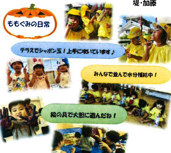
テラスでシャボン玉！上手に吹いています♪