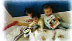
お昼寝前の読書タイム