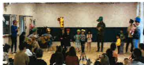
発表会 楽しかったね