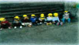
電車見に行って休憩中！