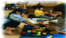
ブロック遊びに夢中